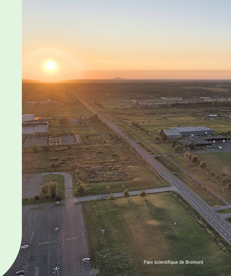
Parc scientifique de Bromont

À titre d'exemple, un travailleur qui décroche un emploi de journalier dans une entreprise du parc scientifique gagne environ 23$ de l'heure, soit environ 41 860$ par année. Il ne devrait pas consacrer plus de 1 047$ pour son loyer afin que celui-ci représente 30% ou moins de ses revenus. Ce montant est toutefois insuffisant à Bromont, où les logements disponibles à ce prix sont rares, voire inexistants. L'accès à la propriété est également difficile, à moins que celui-ci consacre plus de 30% de son revenu pour se loger. Avec son salaire, ce travailleur ne serait pas non plus admissible à un logement social dans la ville selon les plafonds de loyer déterminés par la Société d'habitation du Québec (SHQ). Cette situation bien réelle montre les difficultés auxquelles font face plusieurs travailleurs qui souhaitent travailler et vivre à Bromont.